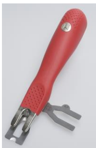
Zum Abstoßen der Schweißschnur empfehlen wir das Mozart Abstoßmesser